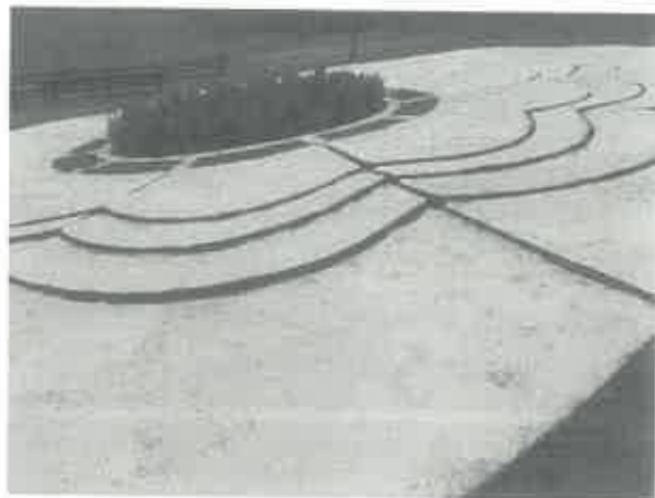
Spomenik Cvijet Srebrenice

Postavljena je rasvjeta, jarbol sa zastavom, neposredno iznad spomenika Cvijeta Srebrenice napravljen je vidikovac od drvene konstrukcije i u podnožju padine tri segmenta natkrivenih mjesta za sjedenje sa klupama i stolom.