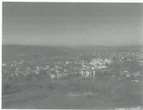
Vizure iz pravca Cvijeta Srebrenice

Ovaj lokalitet je djelimično ograđen ogradom izrađenom od drveta. Međutim, prilikom obilaska terena konstatovano je da se segmenti ove ograde uklanjaju od strane lokalnog stanovništva.