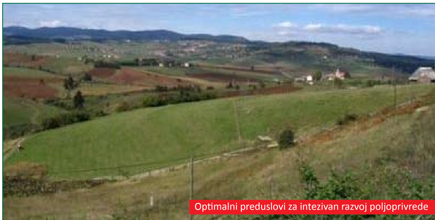
Optimalni preduslovi za intezivan razvoj poljoprivrede

Šta predstavlja težište aktivnosti općinskih organa i službi u cilju stvaranja što povoljnijeg privrednog ambijenta ?